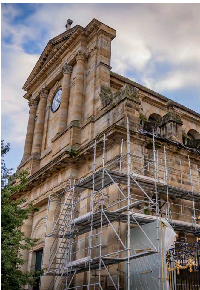
▲ L'Église Notre-Dame entame sa restauration. Les travaux s'achèveront au début du printemps.

Le futur musée Le Panoptique d'Autun-Musée Rolin illustre cette dynamique : tirant profit au maximum des plans de relance nationaux et régionaux, la commune a obtenu un taux de subventionnement exceptionnel de plus de 80%, limitant son reste à charge à environ 6 M€ (19,85%) étalés sur les exercices budgétaires 2020 à 2028. Les projections réalisées par les opérateurs de l'État annoncent au moins 50 000 visiteurs dès 2028, soit un niveau comparable pour commencer, à Bibracte, dans la continuité de la hausse de fréquentation de la cathédrale et du Trésor.