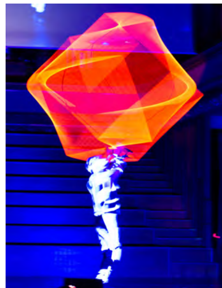
▲ ANTA AGNI, un spectacle gratuit de jonglerie lumineuse et final pyrotechnique ! Le samedi 13 décembre à 19h sur la place du Champ de Mars.

Tout au long du week-end, le Père Noël sera présent, accompagné d'Olaf, le célèbre bonhomme de neige de la Reine des Neiges et d'un renne. Ils déambuleront dans les rues commerçantes pour aller à la rencontre des familles.