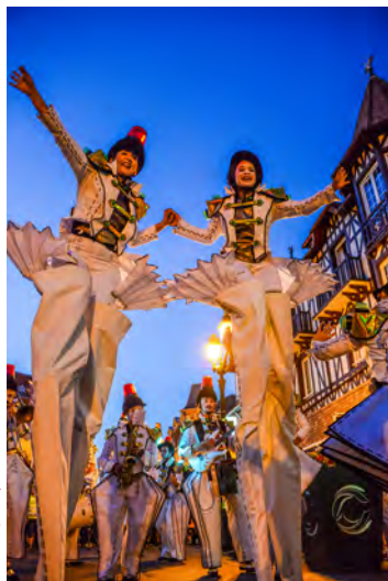
▲ Spectacle "Les Jouets"