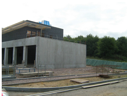
Vue depuis le bâtiment du SDIS