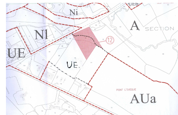
Extrait du PLU, planche F, après révision simplifiée

L'objectif est de permettre la réalisation d'un projet privé relatif à l'implantation d'un équipement hôtelier sur une partie du secteur concerné, une réalisation qui permettrait de compléter l'offre de service présente sur ce secteur de la commune. L'implantation d'une activité hôtelière sur ce secteur va engendrer la création d'emplois sur la commune d'Autun, ce qui va permettre la pérennisation de l'équilibre emploi/habitat sur le territoire communal.