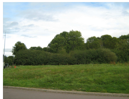
Vue depuis la route de Beaune